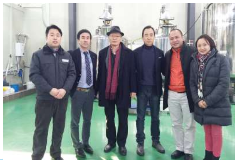
Chuyến công tác tại Hàn Quốc / Business trip in Korea