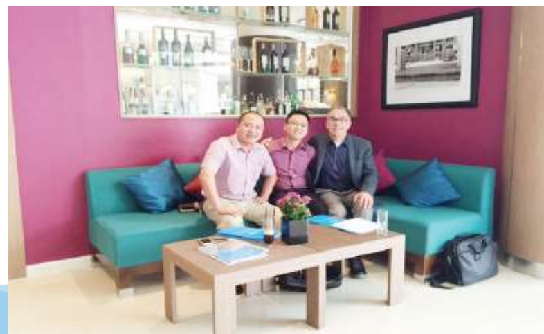
Nhà sản xuất Ý / Italian Manufacturer