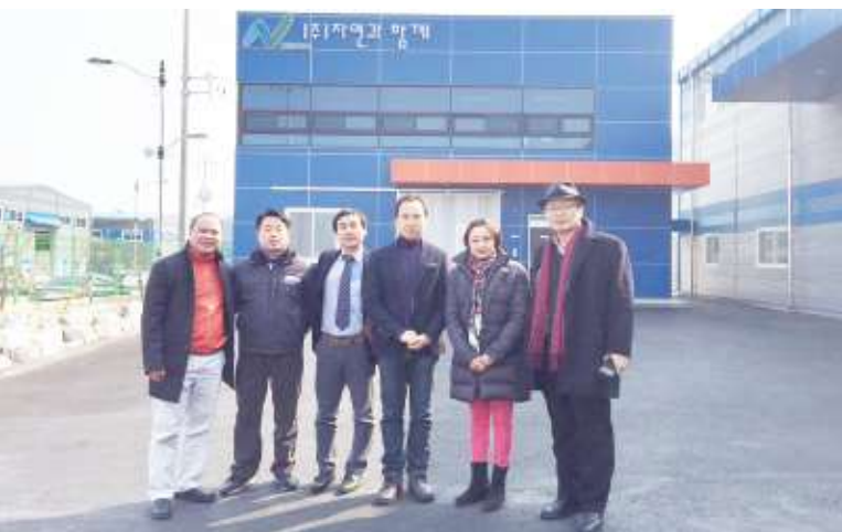
Nhà sản xuất Hàn Quốc / Korean Manufacturer