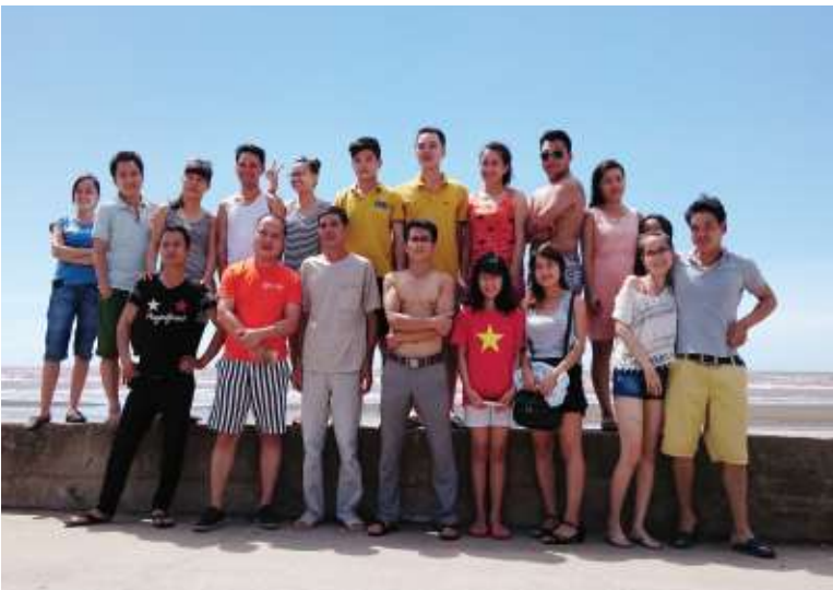
Hình ảnh hoạt động ngoại khóa của The One / Images: Outside activities of The One.

The One performs to create a professional working environment, opportunity to work and equal career development, meanwhile to raise up the capacity and passion, and finally boost up engagement of each employee. And therefore, more and more our employees should be proud of The One"